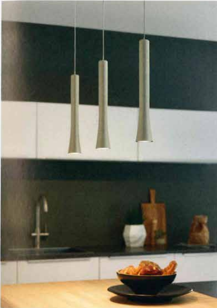
Von modern bis klassisch: Die Pendelleuchte RIO ist in neun Farbstellungen verfügbar.