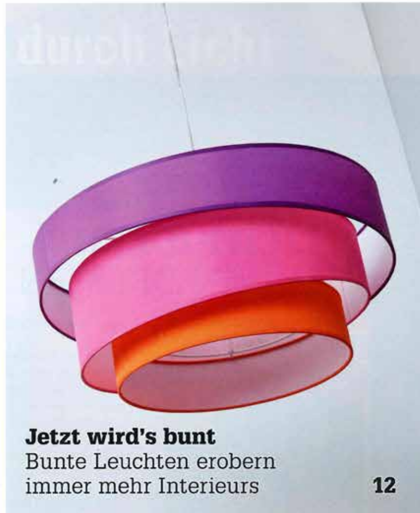
Jetzt wird's bunt Bunte Leuchten erobern immer mehr Interieurs 12