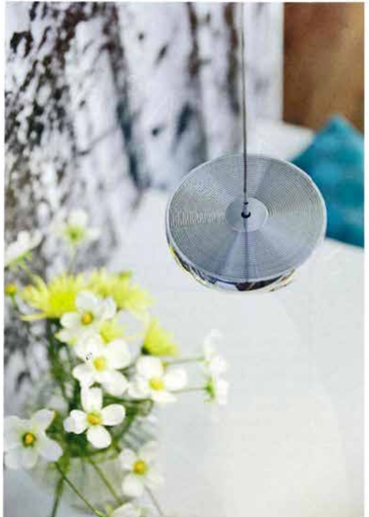
Hochwertige Oberflächen und einzigartiges Design zeichnen die Leuchten von OLIGO aus. (GRACE)